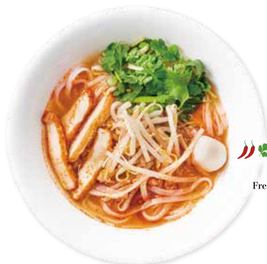
🌿 トムヤムヌードル “センレック トムヤム” Fresh Thai rice noodle with spicy & sour soup ¥630(573)