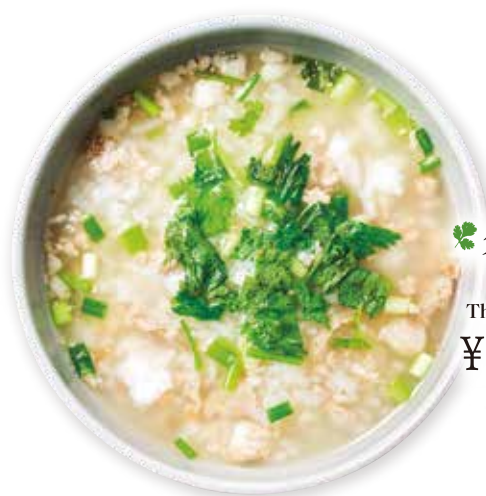
🌿 タイ雑炊 “カオ トム” Thai style rice porridge ¥500(455)